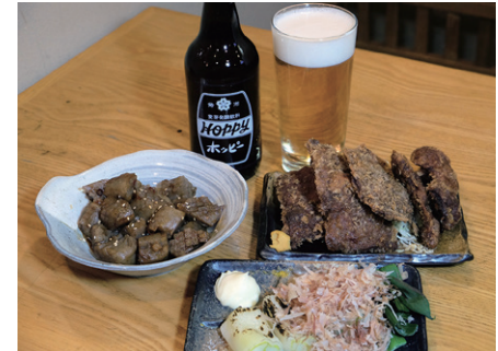
神田 玉とん 東京都千代田区鍛冶町1-7-3 B1 電話：03-5297-0010 営業時間：16:00～23:00(日祝定休)

神田 玉とんでは、群馬県庁と農畜産物販売協力店の提携をし、旬の食材を仕入れている。とりわけ、群馬県のおいしい上州豚は、店のイチ押し食材。やぎとんはもちろん、特製ウスターソースにどぼ漬けたレバーフライは、お店の一番人気で、シャリキンホッピーとの相性は言うまでもなし。また、下仁田ネギや生芋こんにやくなど農家直送の旬の味覚が味わえるのも魅力だ。群馬県産の生芋を使ったピリ辛こんにやくの一味違う食感、ぜひ味わっていただきたい。